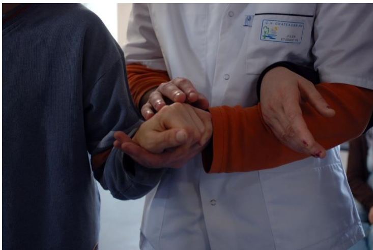
Photo d'une personne d'un établissement en blouse blanche qui tient la main d'une personne et donne le bras à une autre (on ne voit aucun visage que les mains)