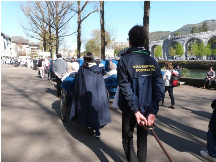
Photo prise à Lourdes, on voit le dos d'un jeune hospitalier qui a sa veste avec la mention Voir Ensemble Hospitalité

Søren Kierkegaard, philosophe danois (1813-1855)