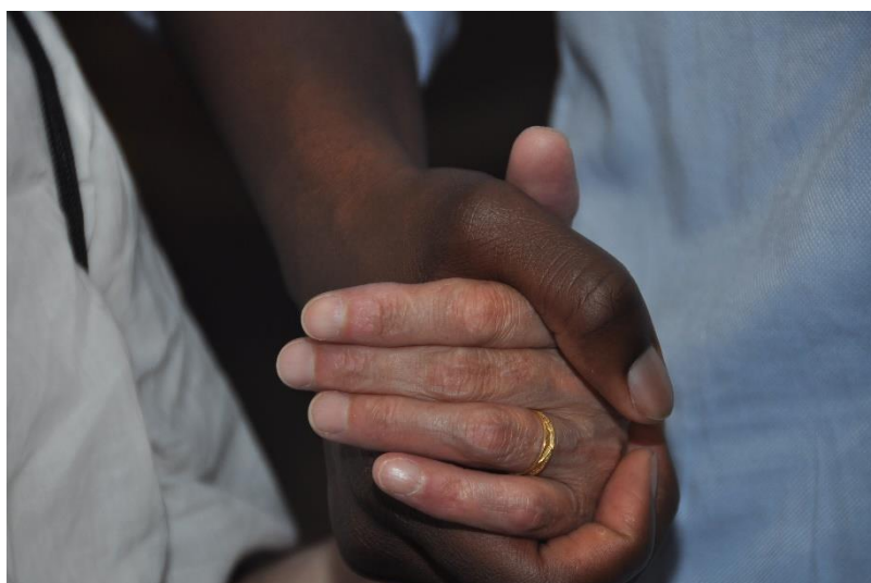
Photo de deux mains enlacées l'une dans l'autre