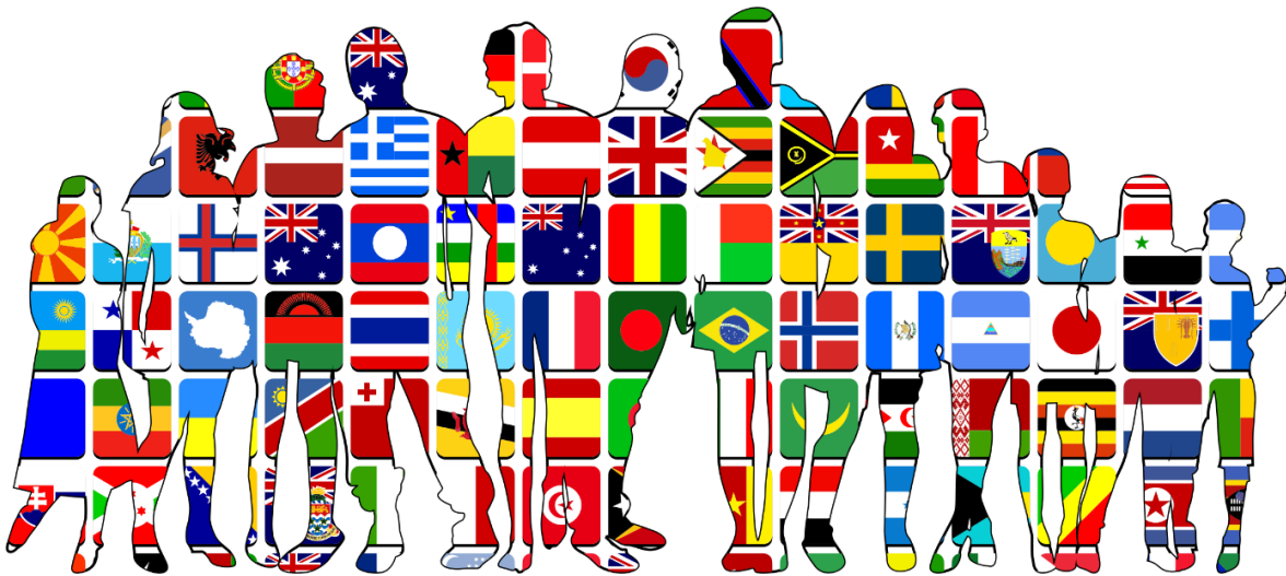
Image de silhouettes humaines sur lesquelles sont représentés les drapeaux du monde