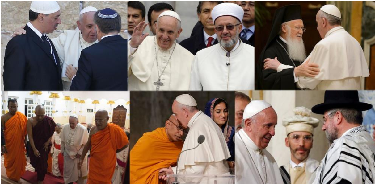
6 petites photos du pape François rencontrant d'autres dignitaires religieux