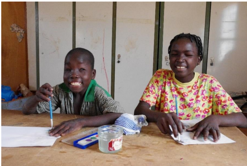
deux jeunes enfants camerounais déficients visuels en train de peindre

La commission de la Solidarité internationale (CSI), au sein de l'association Voir Ensemble, se situe en partenaire des organisations de personnes déficientes visuelles des pays en développement, principalement en Afrique francophone. Depuis sa création, la CSI est intervenue dans une vingtaine de pays où elle a apporté son soutien à une quarantaine d'écoles pour aveugles, soit par la fourniture de matériel didactique, soit par le financement à titre provisoire de la rémunération du personnel d'encadrement. Elle a également financé ou cofinancé de nombreux projets générateurs de revenus conçus et mis en œuvre par des associations locales au service des personnes aveugles et malvoyantes.