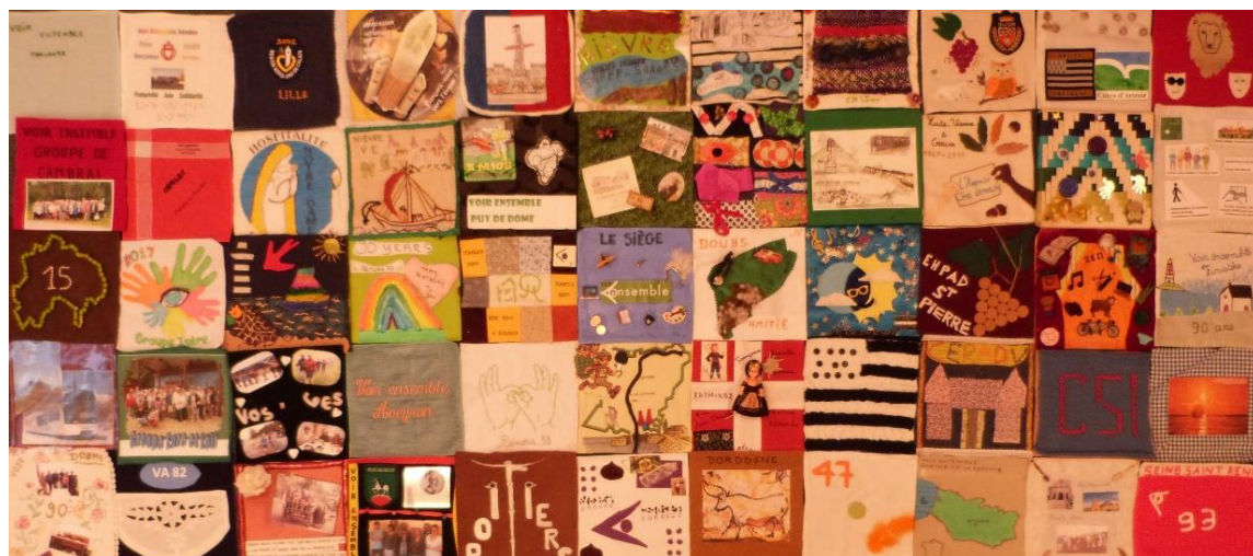
Photo de la fresque des 90 ans